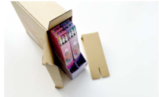
Wo es sinnvoll ist, verzichten wir auf Kunststoff als Verpackungsmaterial

Eine Verpackung soll schützen, aber nicht belasten. Wir reduzieren sie auf das Nötigste und setzen auf Recyclingfähigkeit. In unseren Taschen ersetzen wir vermehrt Schaumstoff-Füllungen durch recycelbare Pappe. Kleinteile wie Plüsch oder Metallprodukte schlagen wir nach Möglichkeit in Papier ein, statt sie in Plastik zu hüllen.