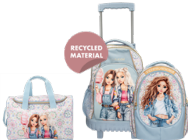
Die TOPModel "Festival Fun"-Kollektion besteht aus recyceltem PET-Material